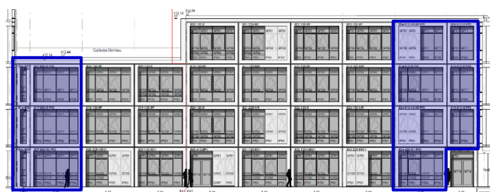
2 - Ansicht Hof Süd mit EI90-Verglasung