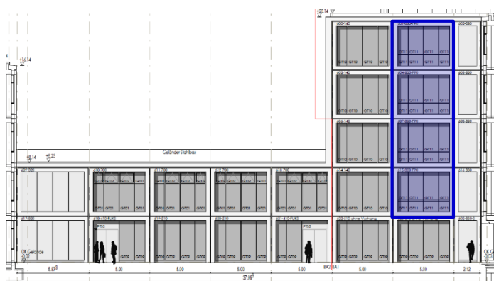
3 - Ansicht Hof Nord mit EI90-Verglasung