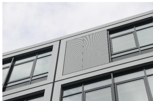
5 - Detail Screen Innenecke Hof Süd / West