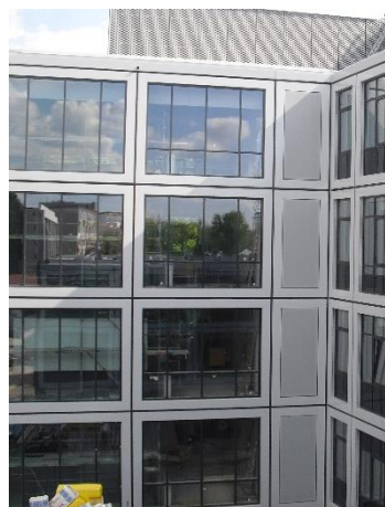
4 - EI90-Verglasung Innenecke Hof Ost / Nord

Auf Grundlage dieser Prüfungen und der geltenden Zulassung für Fassadensystem und Verglasung wurden die entsprechenden